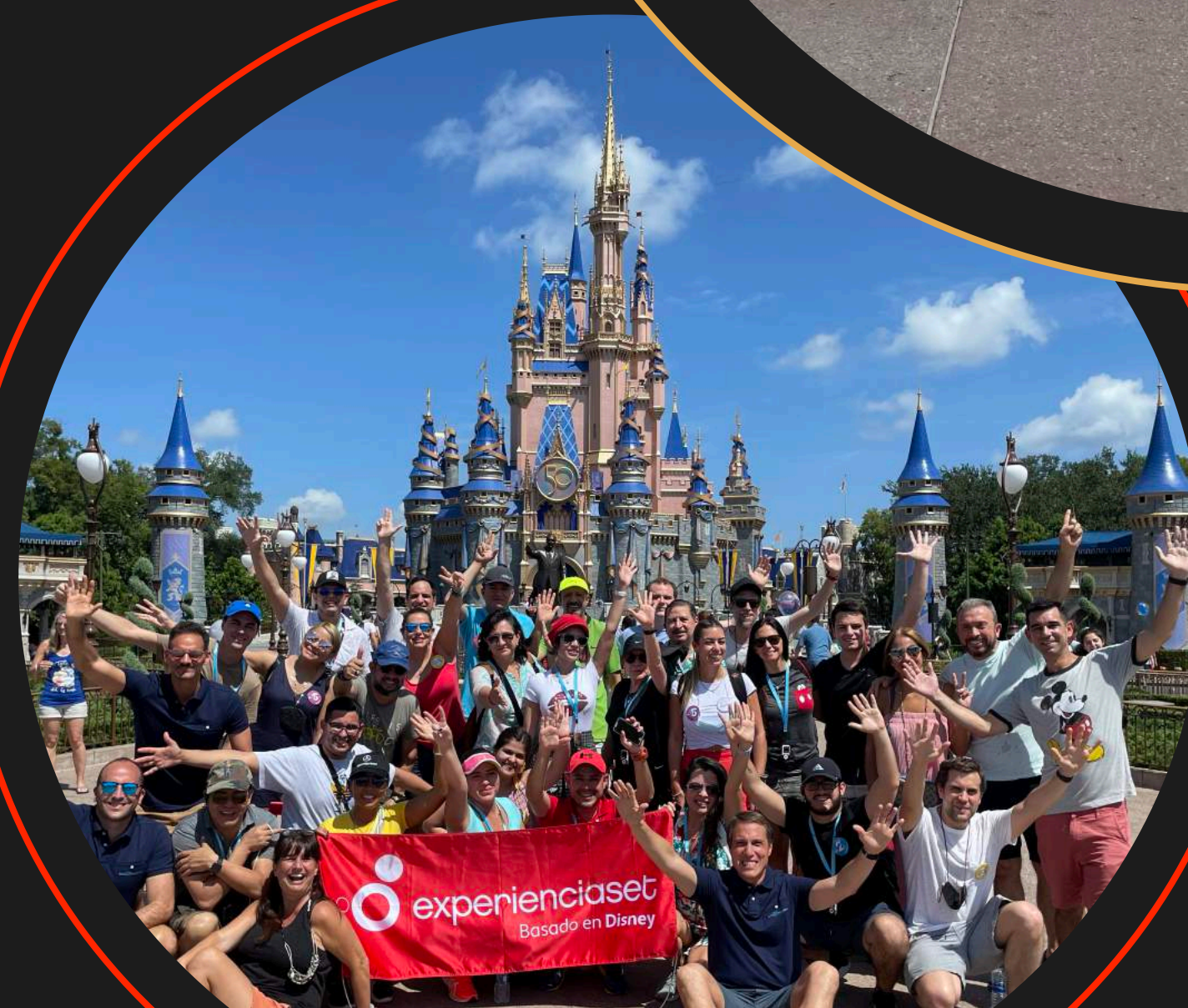
Edición septiembre 2021