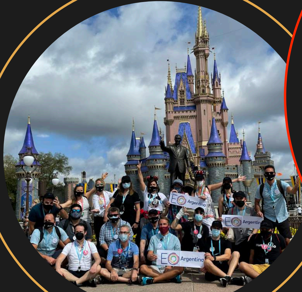
Edición 2021 INCOMPANY Entrepreneur Organization