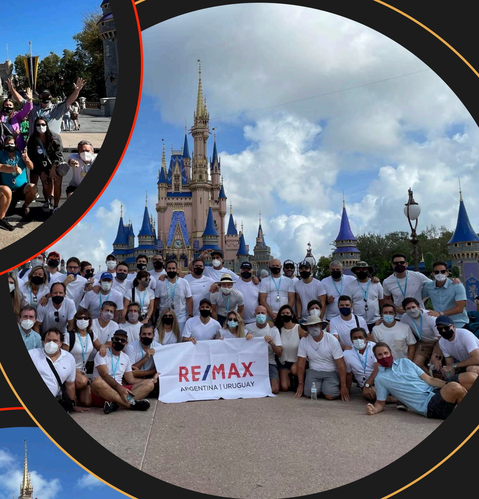
Edición 2021 INCOMPANY RE/MAX