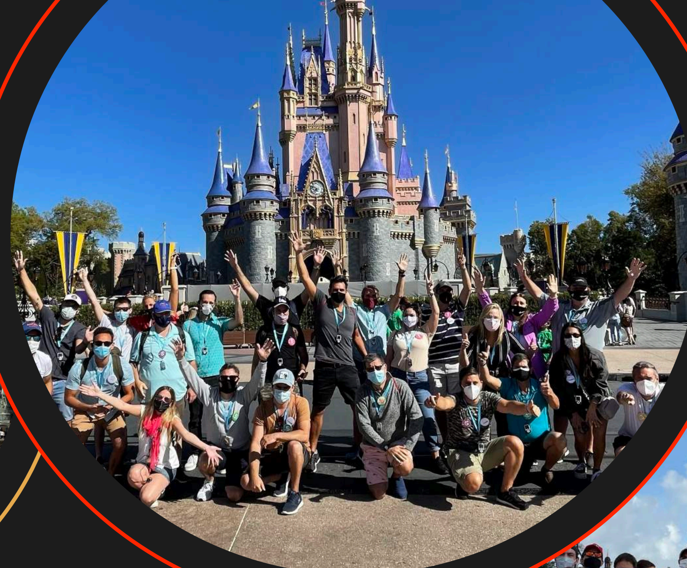
Edición marzo 2021